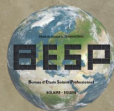
Table solaire By B-E-S-P Filiale du groupe SCTD-INDUSTRIES