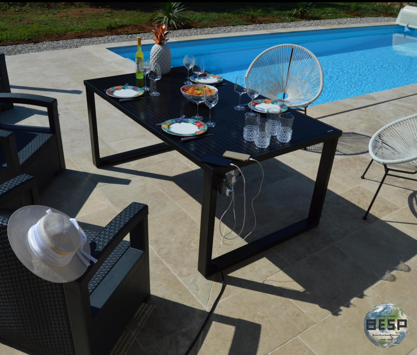
TABLE SOLAIRE EXTERIEURE T-WATT